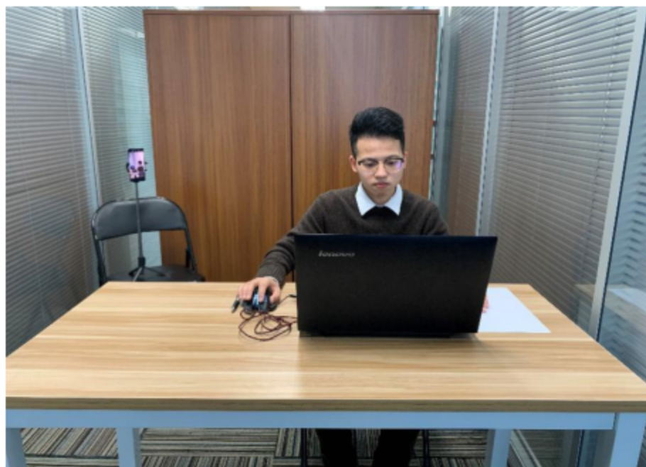
图二：电脑端背面视角