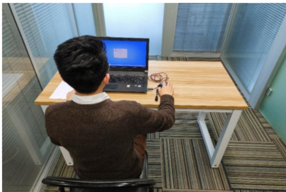
图一：电脑端正面视角